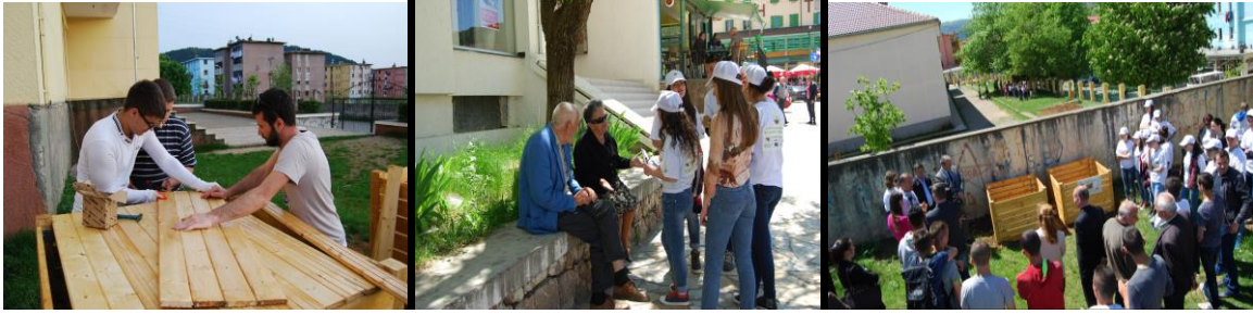
Promovimi i kompostimit në komunitet në Prajonin e Pukës- përfshirja aktive e nxënësve (shkolla e mesme "Sabah Sinani") dhe studentëve

Eventi i hapur apo ëorkshopi mund të mbahet në një nga sallat e NJQV-së, e cila garanton hapësirën e mjaftueshme për të gjithë pjesëmarrësit ose një vend i hapur, psh., pranë një shkolle. Diskutimi cilësor dhe i përbashkët, garanton mbarëvajtjen e programit, dhe nxit bashkëpunimin ndër-familjar për kompostim.