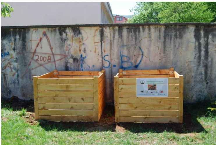
Pamje nga koshi i Kompostimit I ndertuar në Pukë