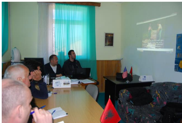
Figura 1: Trajnimi i eksperteve locale për kompostimin ne komunitet në Pukë.

Njohuritë praktike të nxënësve rriten nëpërmjet organizimit të sesioneve/orëve të hapura të praktikës, pranë koshit të kompostimit. Çështje të tilla si përzierja apo ajrosja e kompostit, monitorimi i lagështirës dhe parametrave të tjerë, shoqëruar me njohuri dhe këshilla praktike duhet të bëhet pjesë e programit mësimor dhe programit të kompostimit në shkolla.